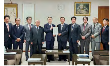
宮城県議会 高橋伸二議長