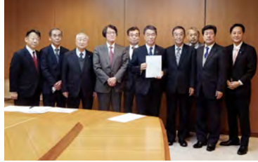
宮城県 村井嘉浩知事