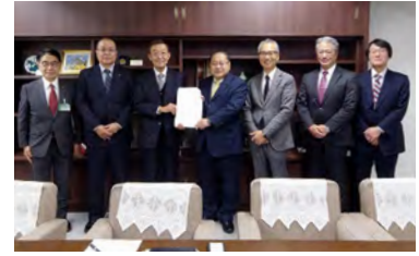
仙台市議会 鈴木広康副議長