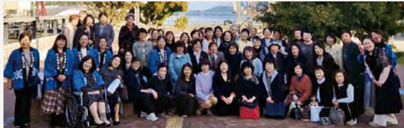
シーパルピア女川で集合写真