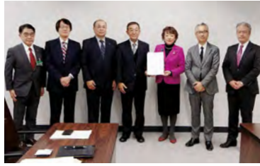
仙台市 郡和子市長

その他我々選挙区の代表である国会議員、自由民主党所属和田政宗参議院議員、立憲民主党所属鎌田さゆり衆議院議員・石垣のり子参議院議員へ秘書を通じて提言の実現に向けた陳情活動を行ってまいりました。