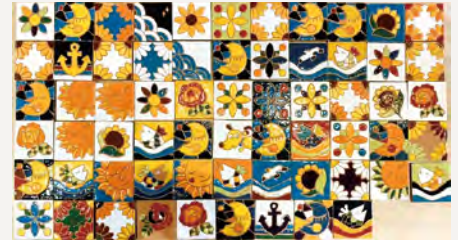
完成したスペインタイル