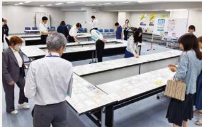
色とりどりのステキな作品が多数!