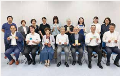
優秀な作品10点を選びました