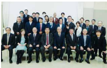
◆4/19(水)黒川支部総会 会場：グランダイニングオオサカ

また総会後には各支部とも懇親会を開催。仕事の話や近況などについて情報交換を行いました。