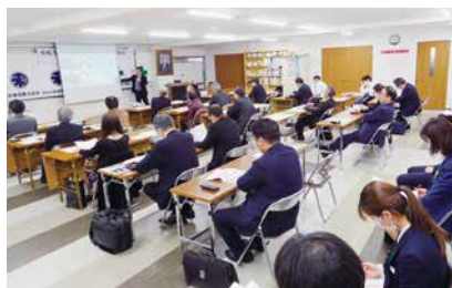
◆4/27(木)中央支部研修会・総会 会場：(株)阿部和工務店～おとな飯 和