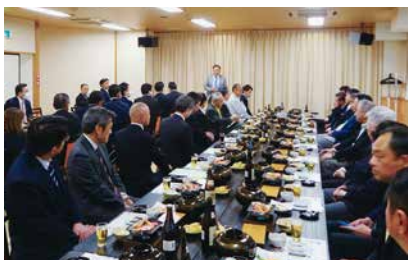
◆4/27(木)泉東・泉西支部総会 会場：力寿司 清柳館