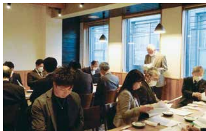
◆4/21(金)北西支部総会 会場：居酒屋 仙さち