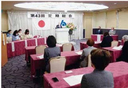
議案説明中の様子

ここ数年のコロナ禍によるダメージ、そして記録的な物価高など、我々の生活に苦しい影響を与えております。そんな暗い世の中ではありますが、諸先輩方からのご指導をいただきながら、部会員の皆様とともにこれまで以上に前向きで、笑顔の絶えない会を目指してまいります。研修事業で自己研鑽に励み、交流事業では結束力を高め、ともに日々成長していきたいと考えておりますので、引き続きのご支援とご協力をお願い申し上げます。