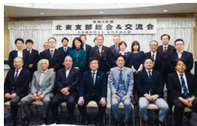
◆4/24(月)北東支部総会 会場：ホテル白萩