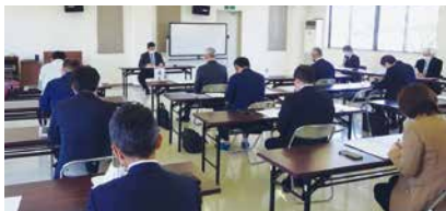
4/20(水)黒川支部総会 会場 くろかわ商工会大和事務所

その後、持ち帰り可能なお弁当を準備するなど会食を自粛した支部もありましたが、感染対策を講じながら3年ぶりとなる異業種交流会を開催した支部もあり、近況などについて気を付けながら情報交換を行いました。