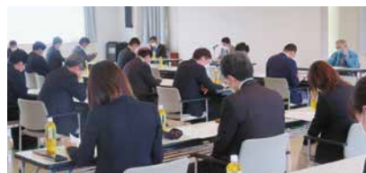
4/26(火)泉東・泉西支部合同総会 会場 みやぎ仙台商工会館