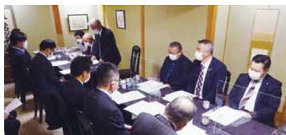
4/25(月)宮城支部総会 会場 和食処割烹 茶々