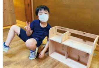
夏休み親子木工教室

当社は昭和元年の創業より、日頃からお世話になっている周辺地域への感謝の念を持ち続け、お客様からのご注文にはできる限りご対応できるよう、常に各種原木を多数取り揃えております。ぜひお気軽にご連絡いただければ幸いです。