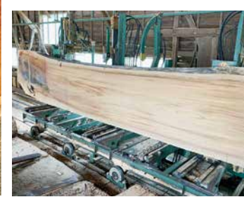
店舗テーブル製材加工の様子

当社では杉、桧、松、樺、栗など、国産材専門店の強みを生かした素材の収集に力を入れており、自社にて収集した木の特徴を見極め、選別しながら特性の違う2台の製材機にて、土木材や建築材を中心に製材、販売しております。また、宮城県産材の活用を推進しており、住宅構造材等のプレカット受注にも力を入れ、納品実績を伸ばしております。