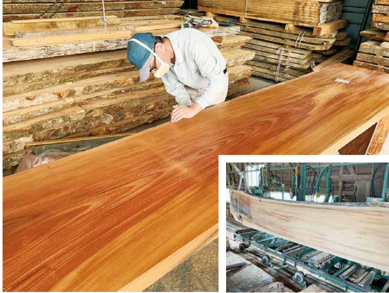
店舗テーブル仕上げの様子