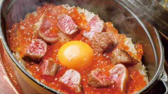
仙台牛といくらの炊き飯(ご注文2人前)