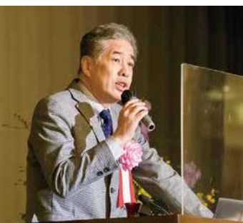
ジャーナリスト 二宮清純氏

総会に先立ち記念講演会が行われ、著名なスポーツジャーナリストである二宮清純氏が登壇。「東京オリンピックへの期待」と題し、東京オリンピックの開催に向けて世論が揺れる中、独自の視点からその開催意義や、「ルールを守る側より作る側」という自説を展開。さらにこれまで取材したスポーツ界の指導者についての様々なエピソードを