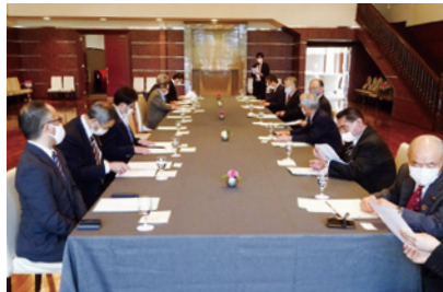
4/26 宮城支部(錦ヶ丘アーリー迎賓館)