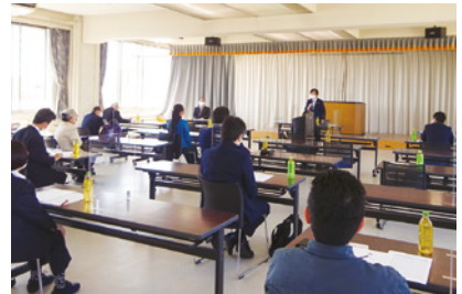
4/27 北東支部(エスポールみやぎ)