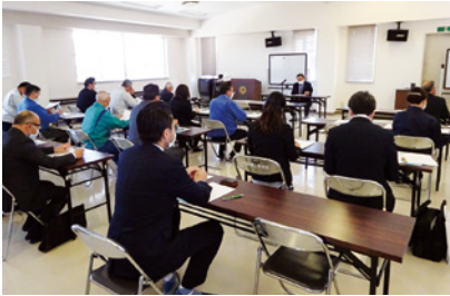
4/20 黒川支部(くろかわ商工会大和事務所)