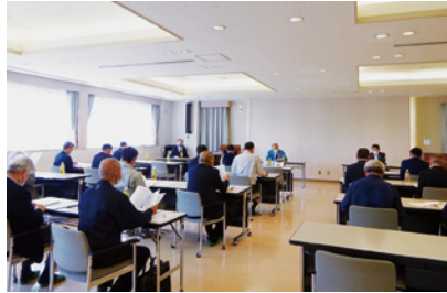
4/22 泉東支部・泉西支部(みやぎ仙台商工会館)