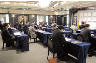
4/23 中央支部(パレスへいあん)