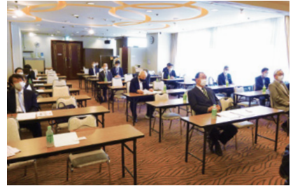
4/22 北西支部(スマイルホテル)