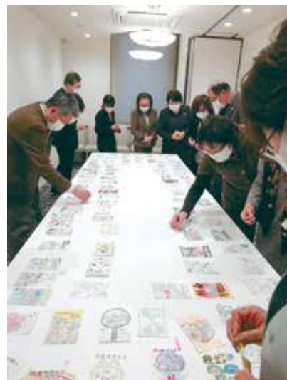
宮城県内の作品選考会の様子

東北六県で入賞された作品は、宮城県法人会連合会のホームページに掲載されるほか、女性部会の全国大会や各地域の公共施設や百貨店のスペースで展示する予定ですので、是非ご覧ください。