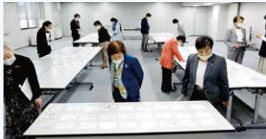
『税に関する絵はがきコンクール』選考の様子

そしてもう一つ、青年部会と女性部会が分担をして管内の小学6年生を対象に「租税教室」を行っています。依頼のあった小学校へ出向き、税金とは何か?なぜ税金が必要か?など子供たちに税の大切さや果たす役割などを学んでもらうための「出前授業」です。青年部会・女性部会がそれぞれ講師役を担当し、多数のパネルを用いたり、クイズや寸劇も織り交ぜながら、楽しくわかりやすく伝えるよう工夫して授業を行っています。今年度はコロナ禍の影響で予定が変更になった場面もありましたが、学校側とも事前に打ち合わせを重ね、三密回避などの対策を講じた上で授業を行いました。