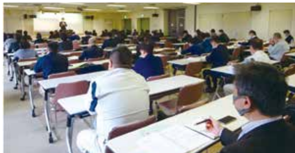
管理職のための基礎力強化セミナー