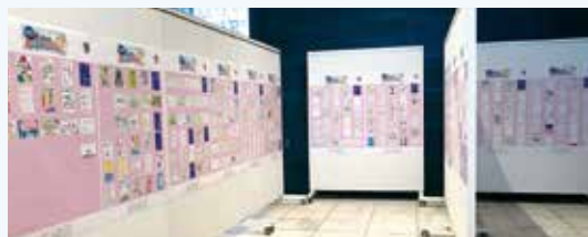
『税の絵はがき展』応募作品展示