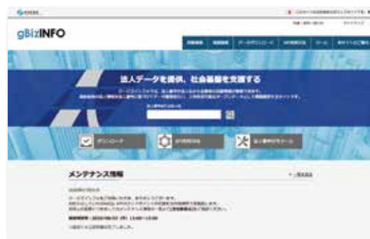
G Biz インフォ トップ画面