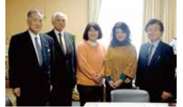
ラ・サール・ホーム