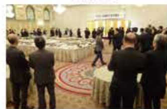
賀詞交歓会の様子