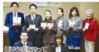
優秀作品を持って

選ばれた10点は、宮城県法人会連合会女性部会連絡協議会主催の選考会(2/10)、東北六県女性部会代表者懇談会主催の選考会(2/14)へと提出されます。