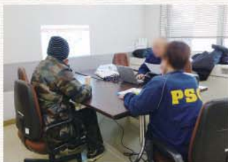
住まいと暮らしの相談会(仙台市の転居支援)

これからも私たちは、仕事や生活上での様々な悩みを抱えた人達に対して、伴走型の支援を行つていきたいと考えております。そのために、もまず、PSCプラスで安心して生活できる空間を提供できればと考えられております。