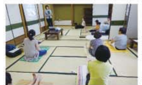
リラックスしながらのリンパマッサージ

青年部会会員大募集中! 詳しくはホームページで http://www.yg88.com/