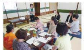
日常生活をチェックの様子