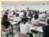
経理の実務講座の様子