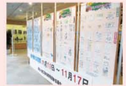
税の絵はがき展示コーナー