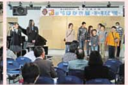
高校生による租税教室&税金クイズ