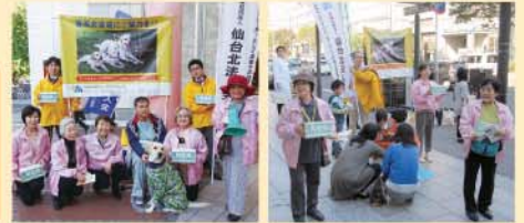
仙台フォーラス前(平成27年度) 一番町平和ビル前(平成27年度)