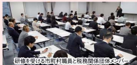
研修を受ける市町村職員と税務関係団体メンバー

また、最近仙台市では、新しい学習施設「仙台子ども体験プラザ」が開設されるなどキャリア教育が重要視されているようで、経済状況の変化とともに教育をめぐる状況も変化していることを知ることができました。