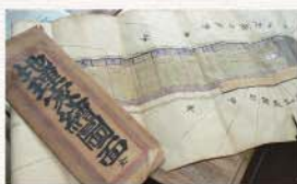
明治34年(推定)に描かれた「大坂屋旅館」の建築図面。