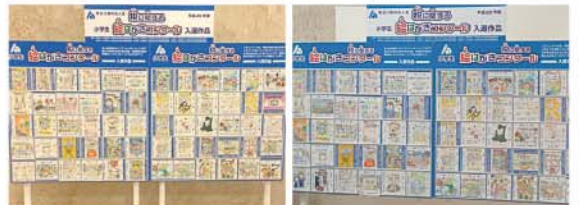
新仙台ビルディング様

小学6年生を対象に募集している『税に関する絵はがきコンクール』。昨年度の東北6県からの入賞作品が掲示されています。東北各県で掲示しておりますので、お見かけの際は、ぜひ素晴らしい作品をご覧になっていただきたいと存じます。