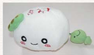
創業100年を記念して制作したキャラクターの「すんだんどちゃん」

また、私は大学では商業科専攻でしたので、周りの仲間たちに自分の家の(店の)帳簿を見せてアドバイスを貰いながら簿記などの勉強もしました。実は大学を卒業した時、ある企業から内定を頂いていたのですが、父に「出て行くのなら、二度とこの家の敷居はまたぐな」と言われ、いくら何でもそれは困るので家業を継ぐ決心をした訳です。