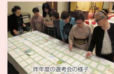
昨年度の選考会の様子

当会は、仙台北税務署管内にある小学校82校の約5,900名の6年生を対象に募集。子どもたちから寄せられた作品を2月上旬の選考会で審査することとしております。